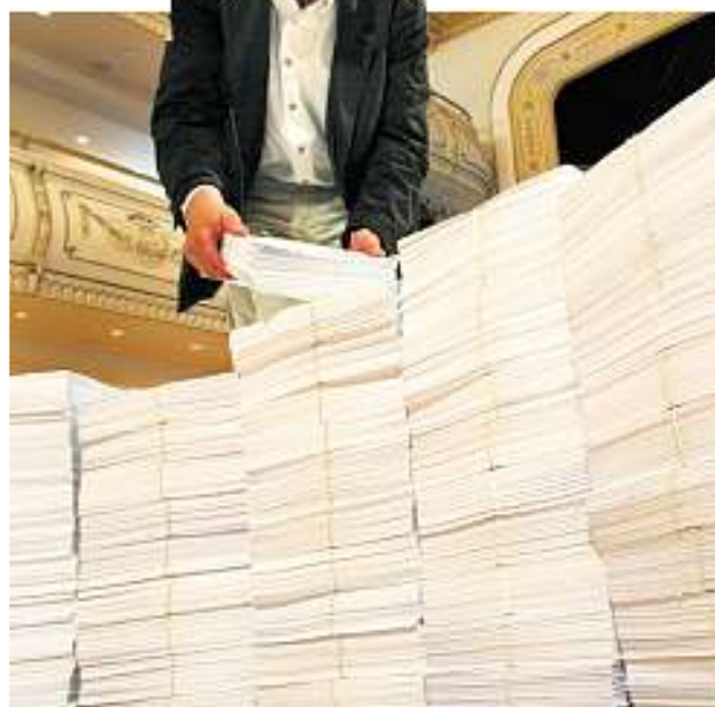
1,25 Tonnen wiegen die Bögen mit den gesammelten Unterschriften für das Volksbegehren „Mehr Demokratie in Thüringer Kommunen“. Sie wurden gestern im Erfurter Kaisersaal präsentiert. Seite Thüringen

Die etwa 31 400 Thüringer Handwerksbetriebe zählten im vergangenen Jahr rund 140 000 Beschäftigte.